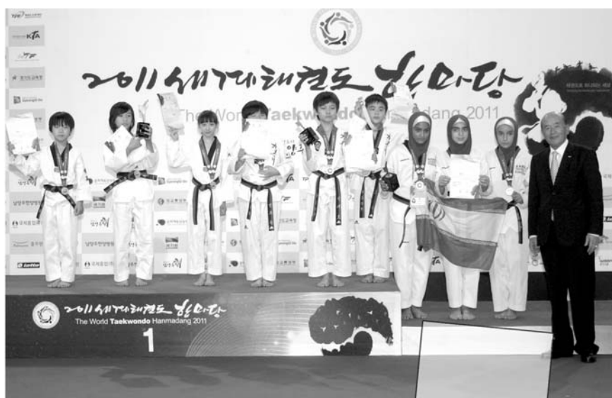
کسب مقام نخست جهان آنهم در هان مادانگ؛