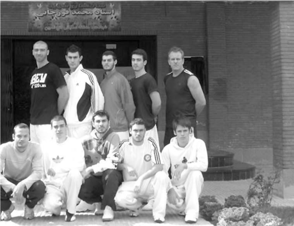
مرکز جهانی تکواندو ایران میزبان هوگوپوشان فارسی :